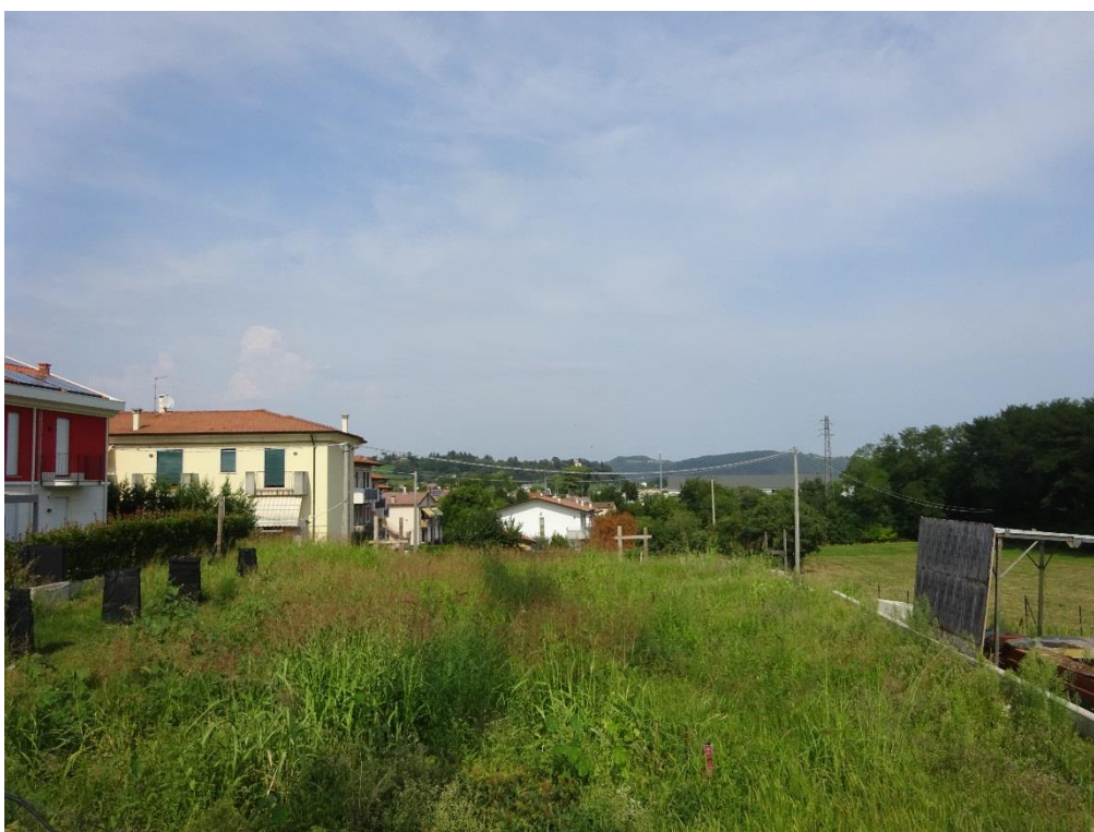
Vista n. 2