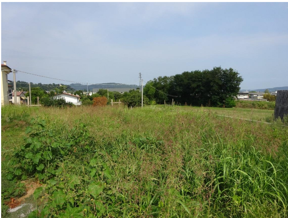
Vista n. 1