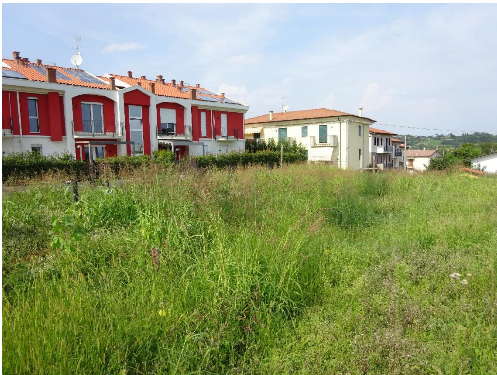
Vista n. 4