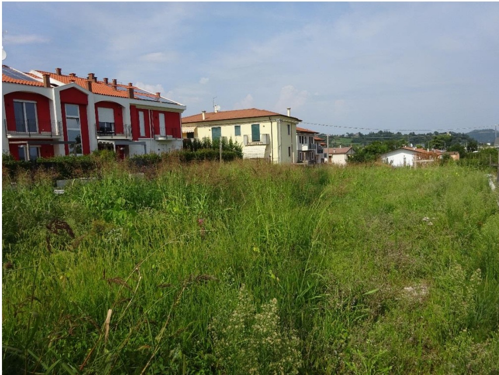
Vista n. 3